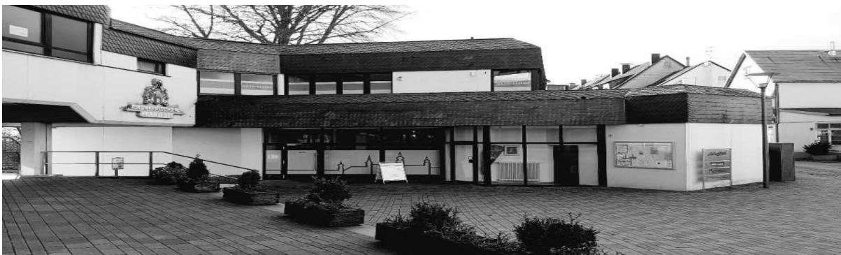
Haus der Begegnung am Schloßmacherplatz

An jedem dritten Mittwoch im Monat findet die Beratung auch im Bürgerzentrum Wupper (Siedlungsweg 24) statt.